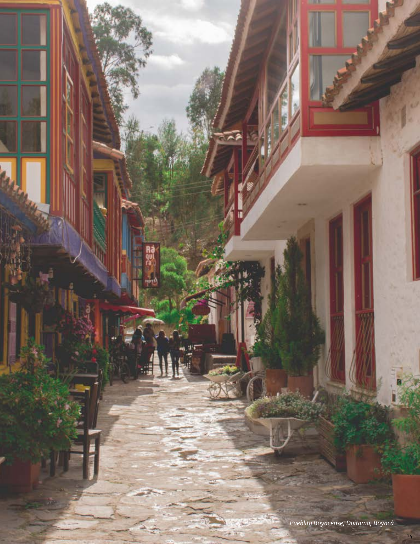
Pueblito Boyacense, Duitama, Boyacá