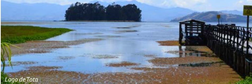
Lago de Tota

Ganadores premio nacional de calidad 2018-2019 Turismo Sostenible