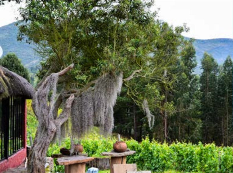
Viñedos de Punta Larga