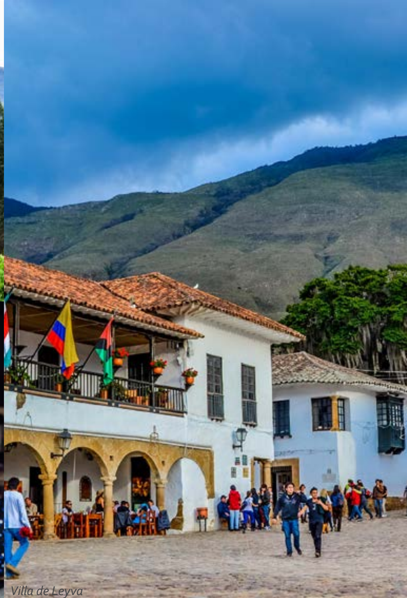
Villa de Leyva