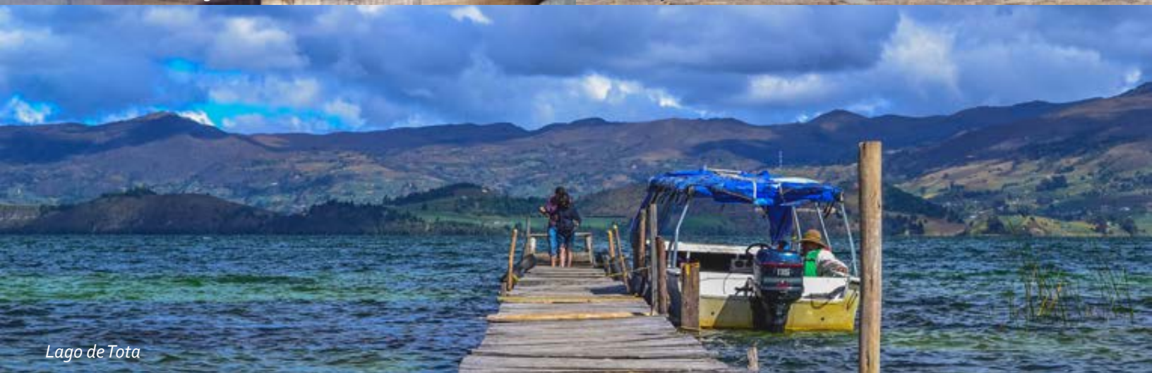
Lago de Tota