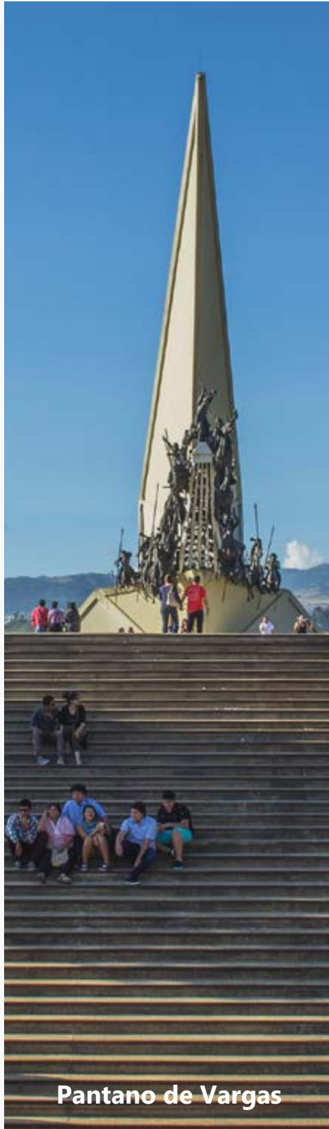
Pantano de Vargas