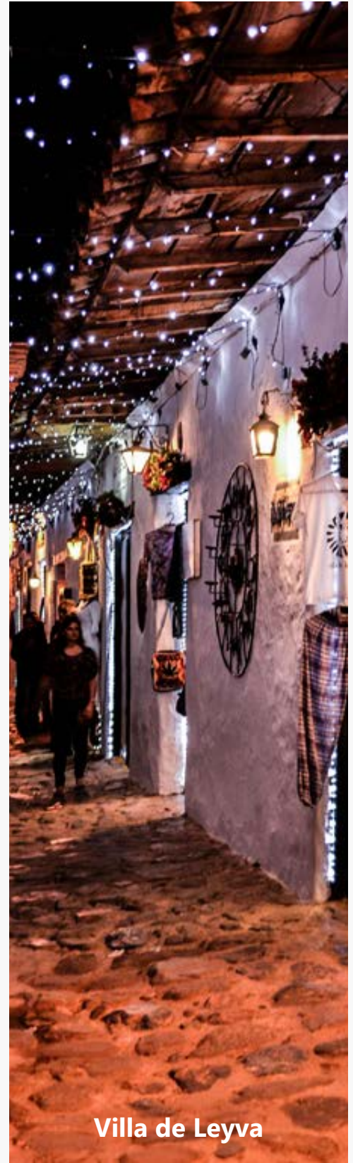
Villa de Leyva