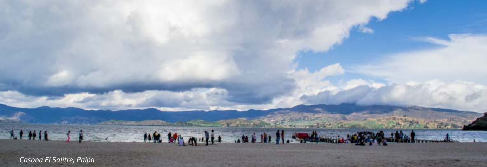
Casona El Salitre, Paipa