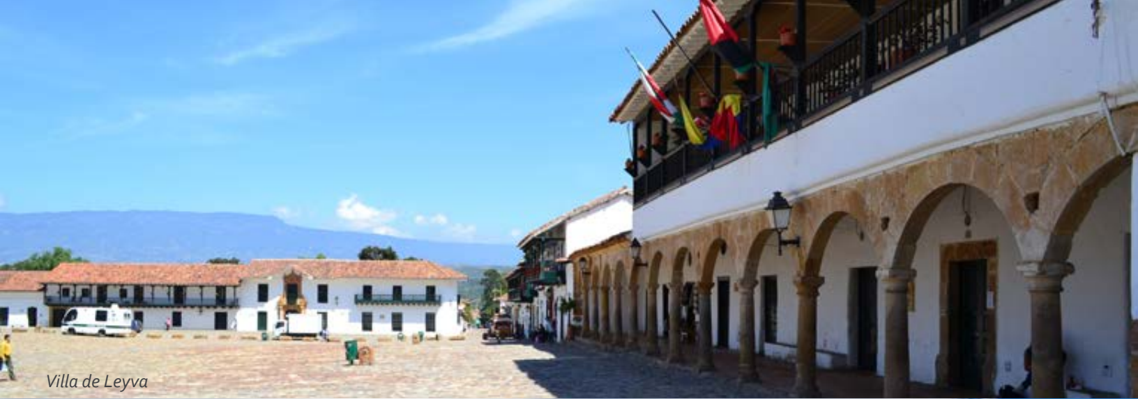
Villa de Leyva