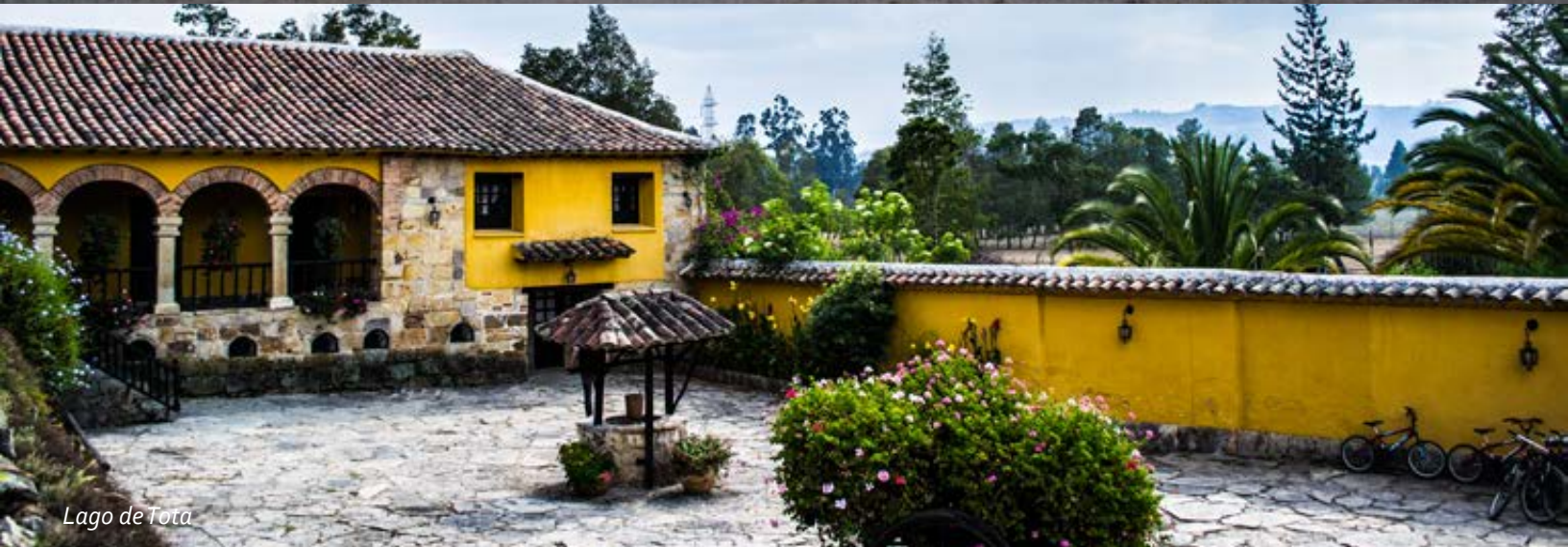
Lago de Tota