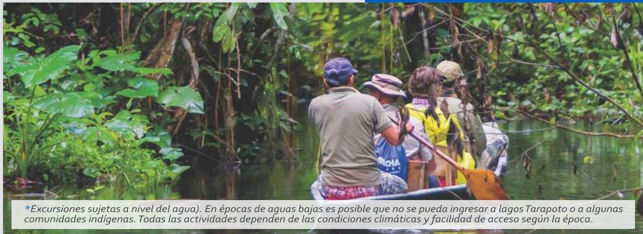
*Excursiones sujetas a nivel del agua). En épocas de aguas bajas es posible que no se pueda ingresar a lagos Tarapoto o a algunas comunidades indígenas. Todas las actividades dependen de las condiciones climáticas y facilidad de acceso según la época.