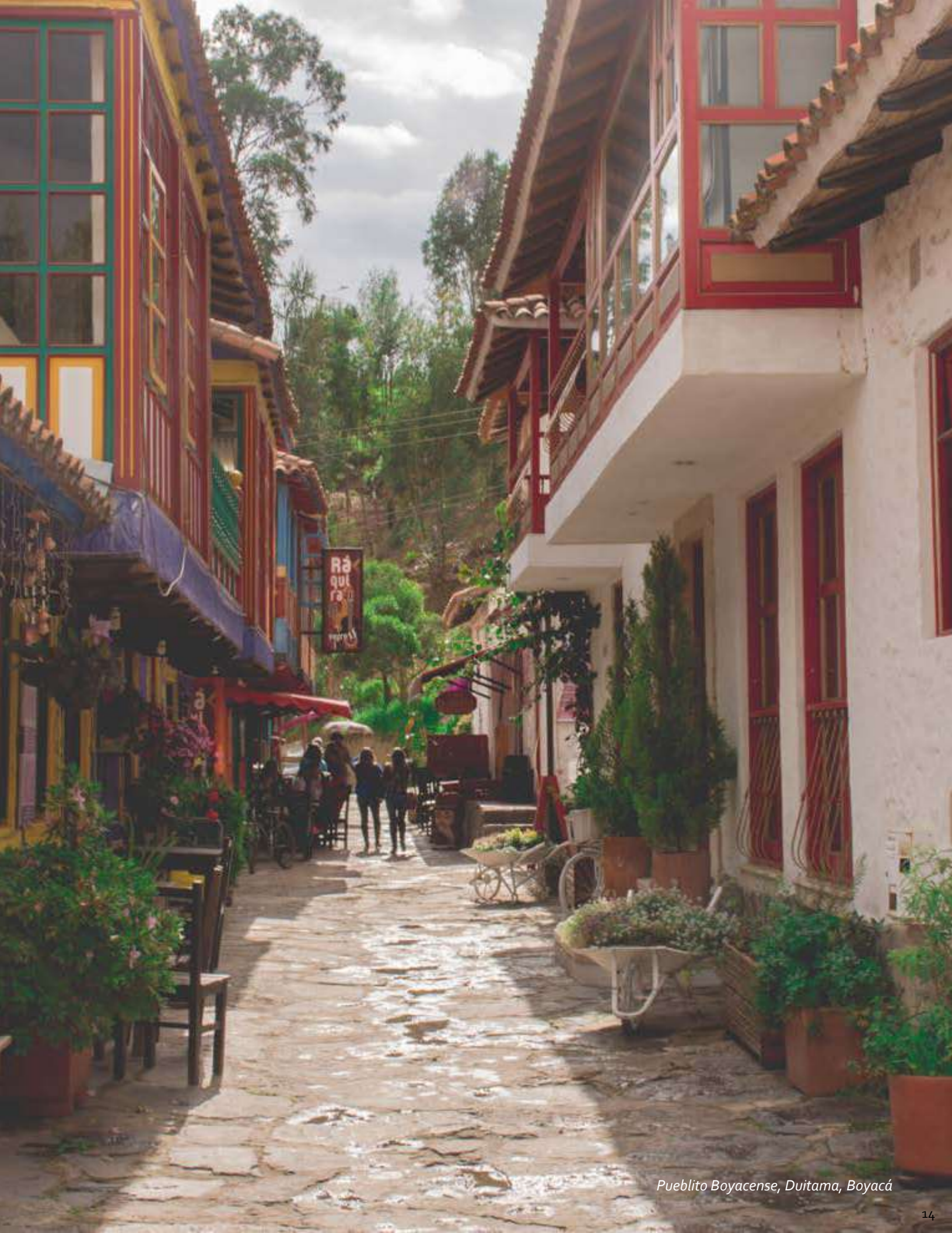
Pueblito Boyacense, Duitama, Boyacá