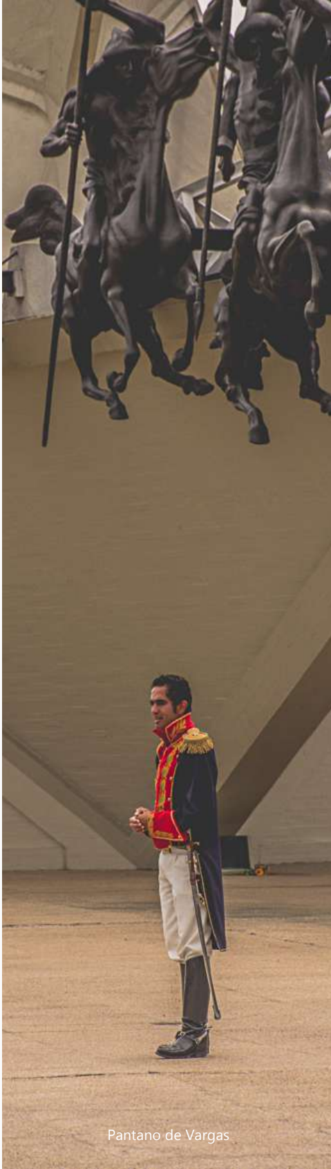
Pantano de Vargas