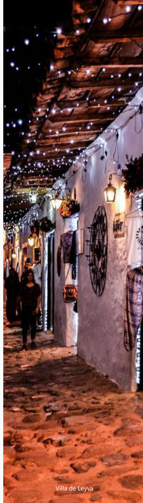
Villa de Leyva