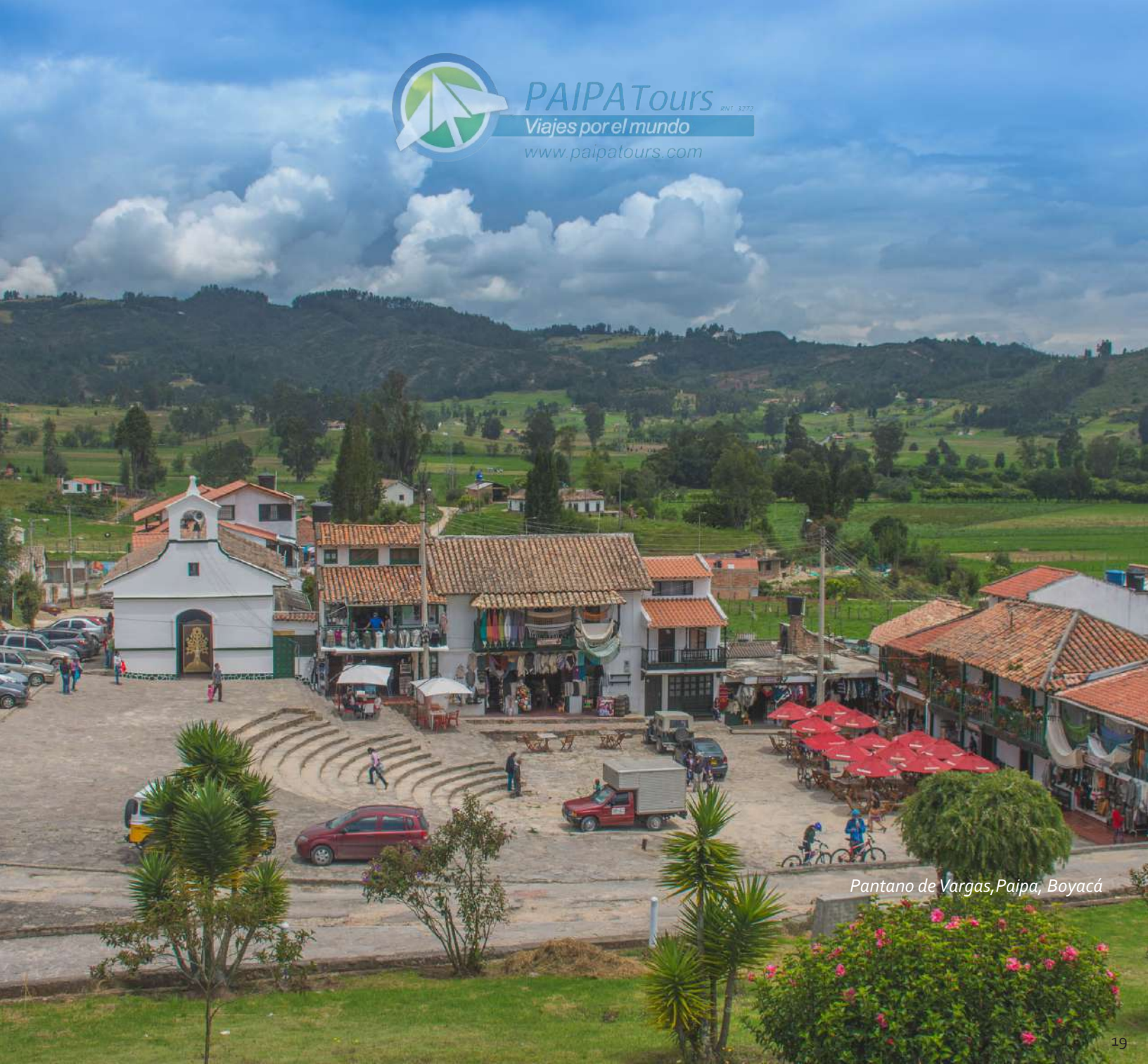
Pantano de Vargas, Paipa, Boyacá

PAIPA Tours RN1 3372 Viajes por el mundo www.paipatours.com