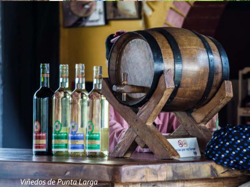
Viñedos de Punta Larga