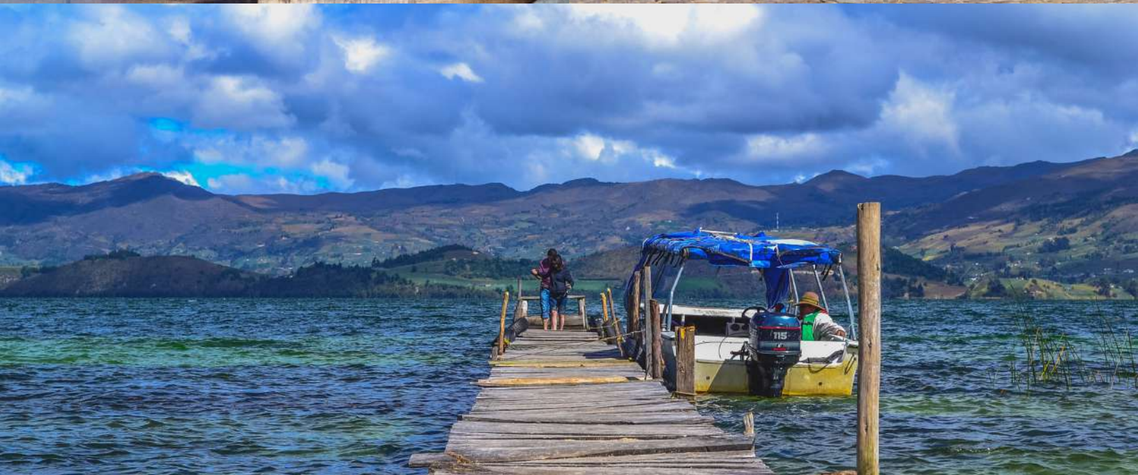
Villa de Leyva