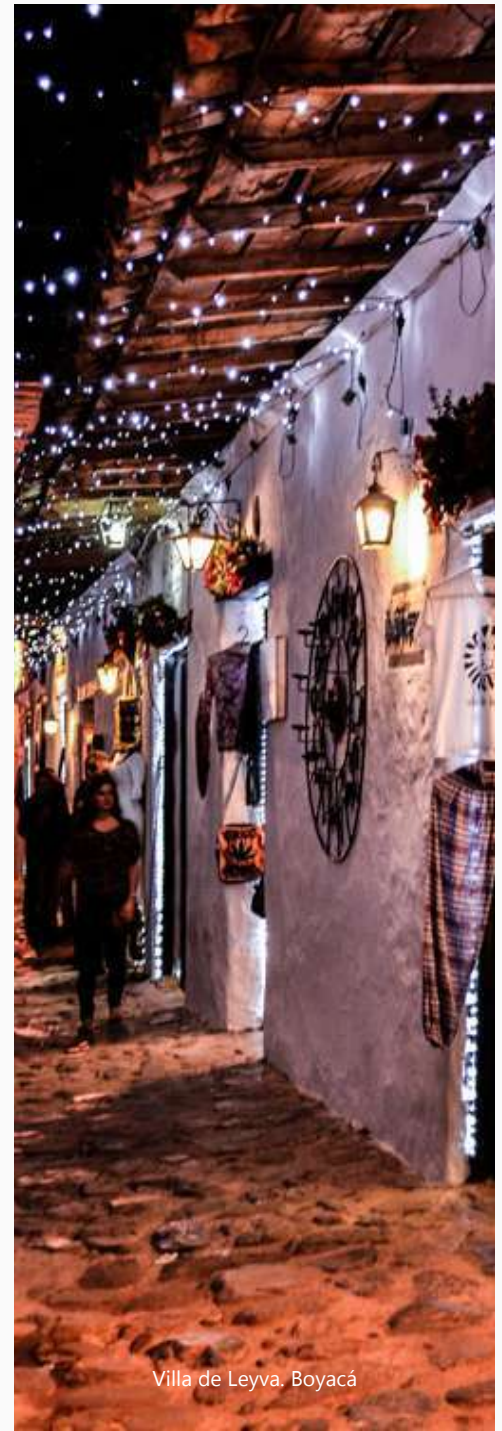
Villa de Leyva, Boyacá