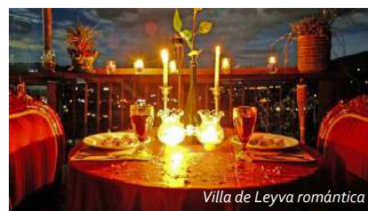
Villa de Leyva romántica