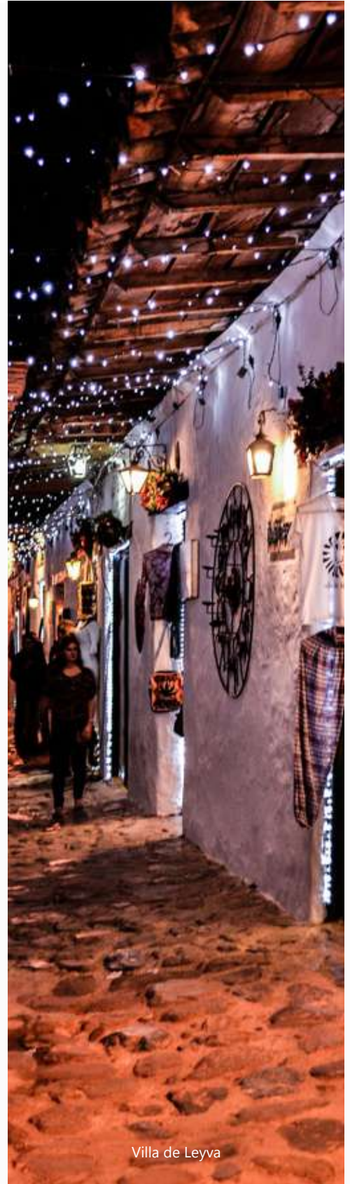
Villa de Leyva