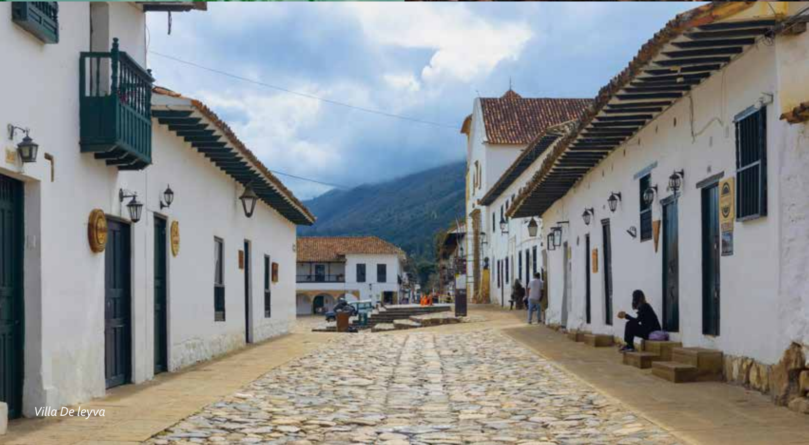
Villa De leyva