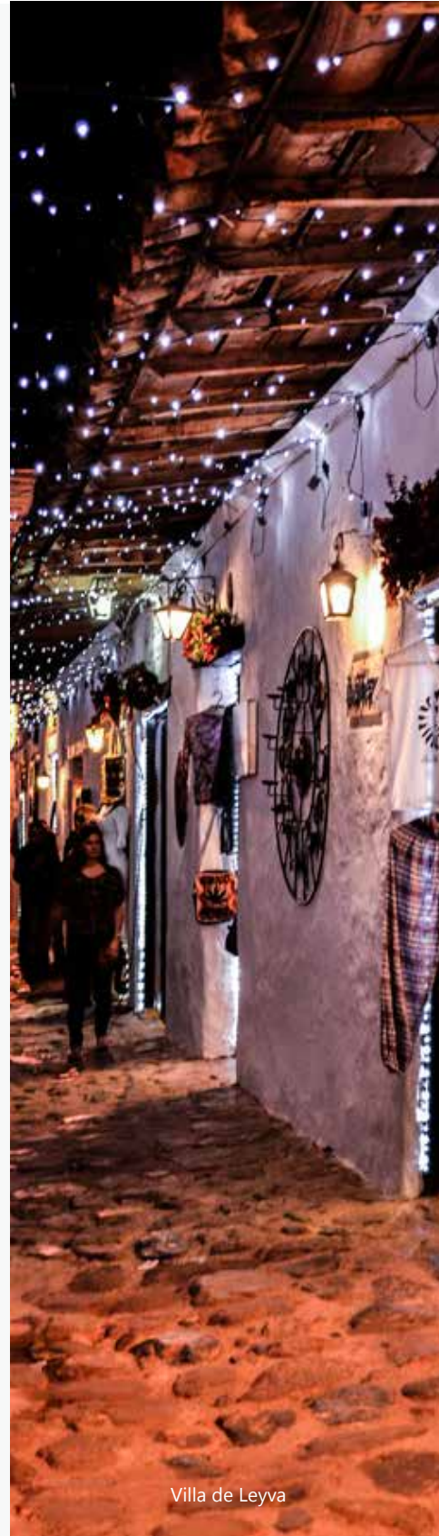
Villa de Leyva