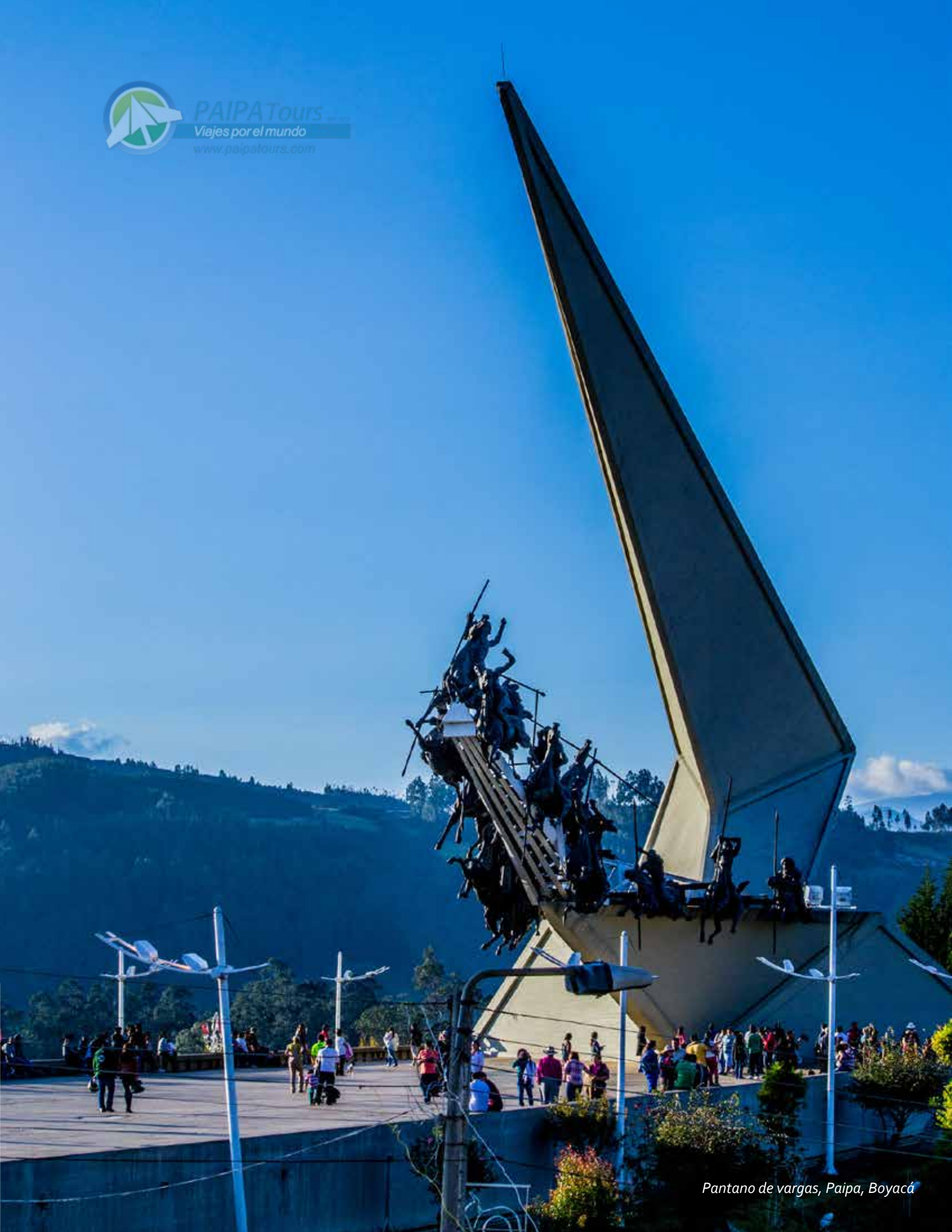
Pantano de vargas, Paipa, Boyacá