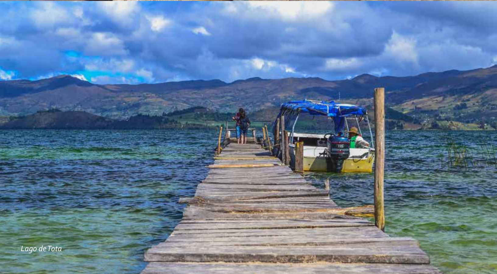
Lago de Tota