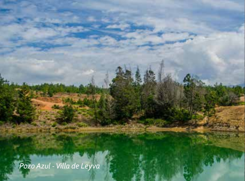
Pozo Azul - Villa de Leyva