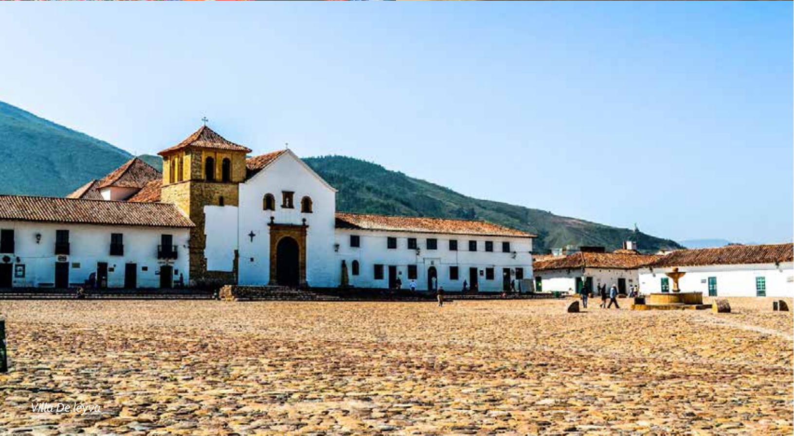
Villa De leyva