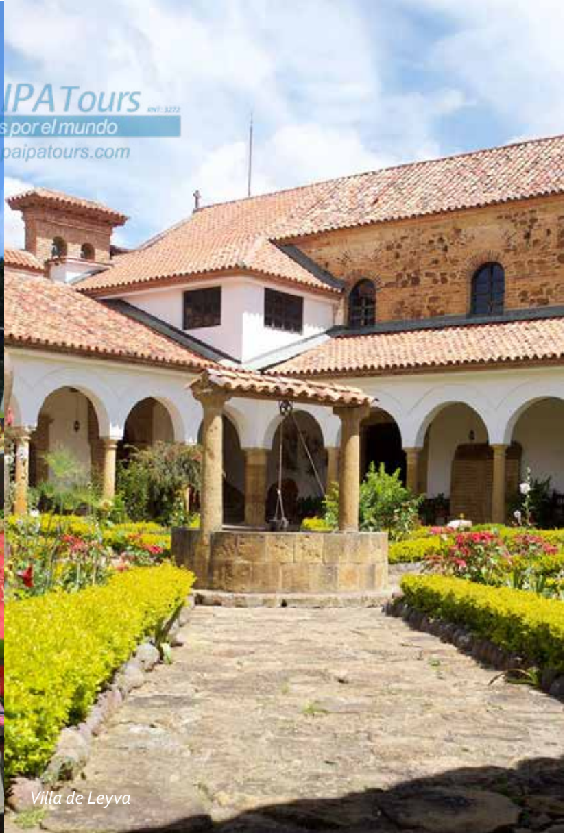
Villa de Leyva