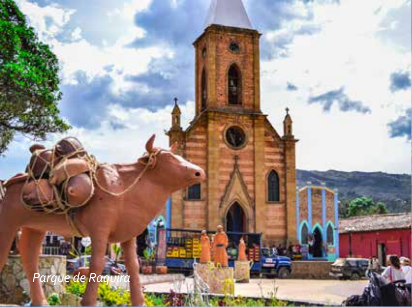
Parque de Raquira