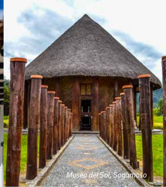
Museo del Sol, Sogamoso