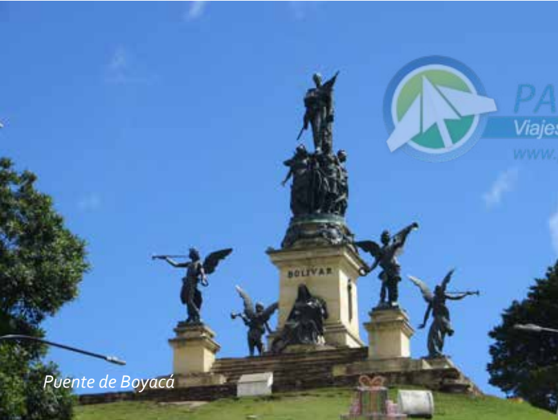
Puente de Boyacá

PAIPATours env. 3272 Viajes por el mundo www.paipatours.com