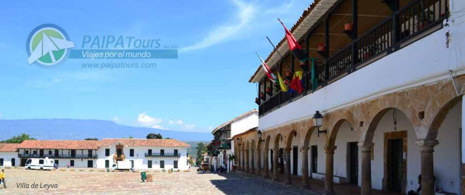
Villa de Leyva

PAIPATours RNT 3272 Viajes por el mundo www.paipatours.com