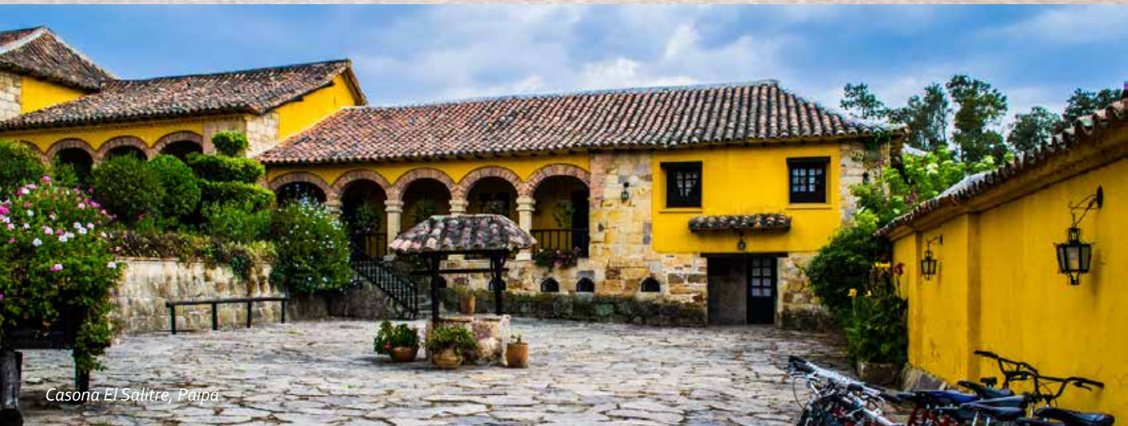
Casona El Salitre, Paipa