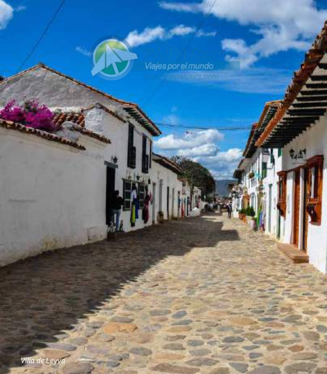
Villa de Leyva

PAIPA TOURS Viajes por el mundo www.paipatours.com