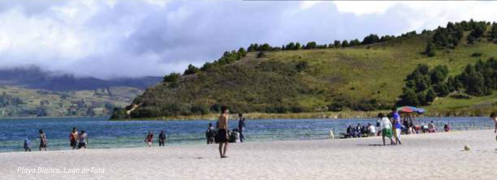
Playa Blanca, Lago de Tota