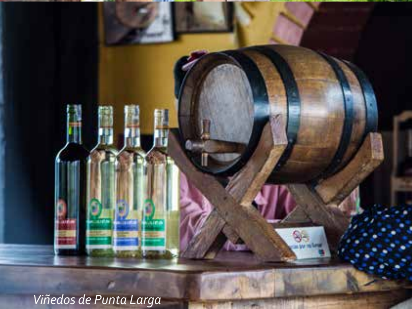
Viñedos de Punta Larga