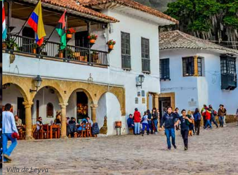
Villa de Leyva