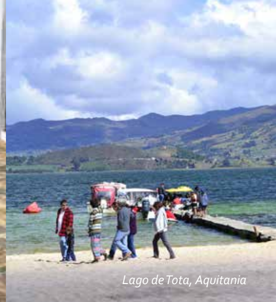
Lago de Tota, Aquitania