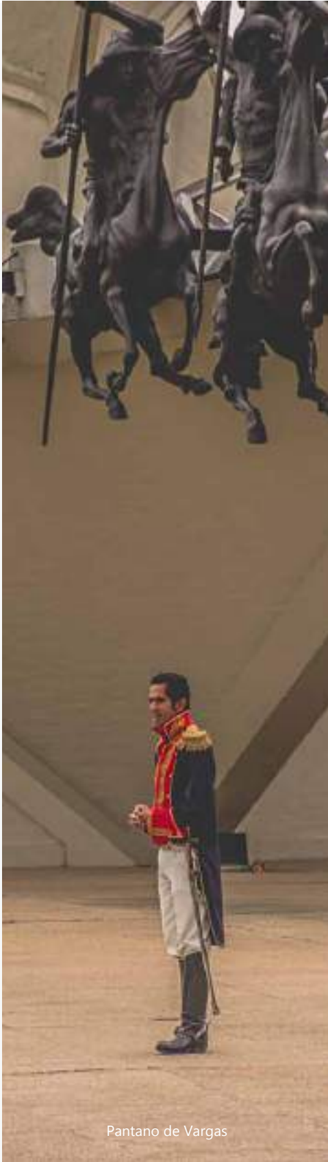
Pantano de Vargas